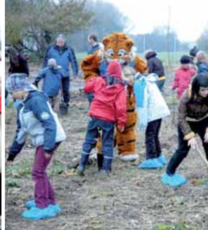
Gemeinsam gegen CO 2 - Wir sind dabei! Pflanzaktion mit BASF-Mitarbeitern am 5. 11. 2009 in Zeititz bei Bennewitz