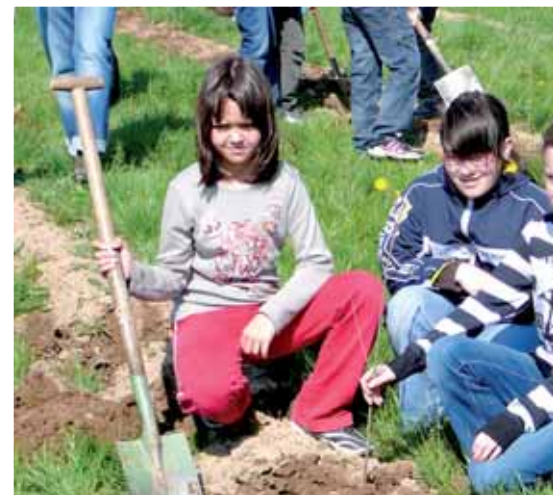
Stolz auf die Baumpflanzung