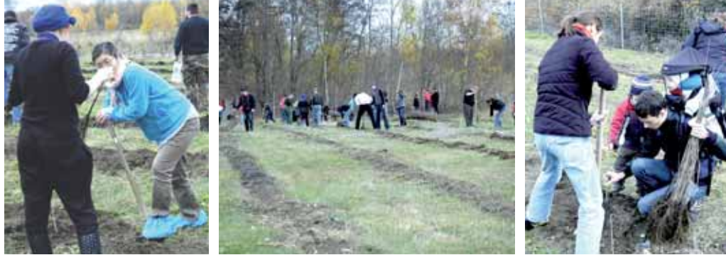
Impressionen von der Pflanzaktion am 14. November 2009 in Großzossen