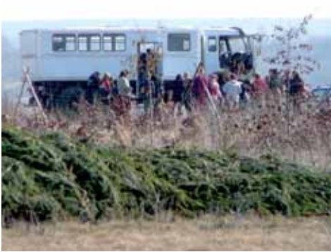
Busfahrt mit MIBRAG-Bus in den Tagebau