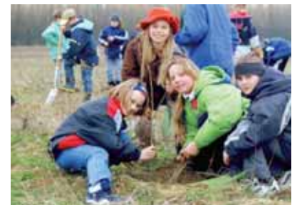
Foto oben: Exkursion von Pflanzhelfern im Sommer 1999 – noch ist das Unkraut höher als die Bäume Foto unten: Eine der 11 Pflanzaktionen