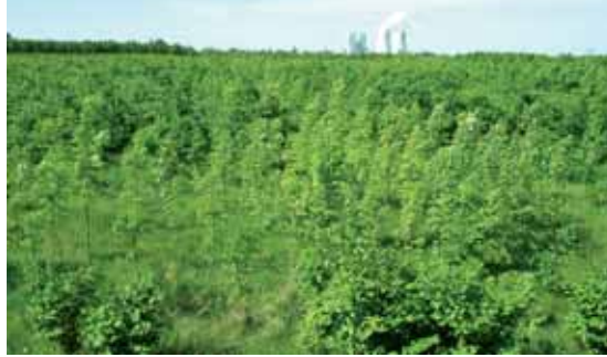
Foto links: Das erfolgreich aufgeforstete Röhthaer Holz

Grafik Seite 5: Karte des geplanten Autobahnabschnitts