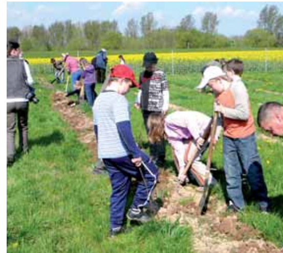
Mit Elan ging es an die Arbeit

Gut ist, dass es am angrenzenden Standort mit der Waldmehrung weiter gehen kann. Die Genehmigung zur Aufforstung liegt nach langem Streit mit den Behörden nun endlich vor.